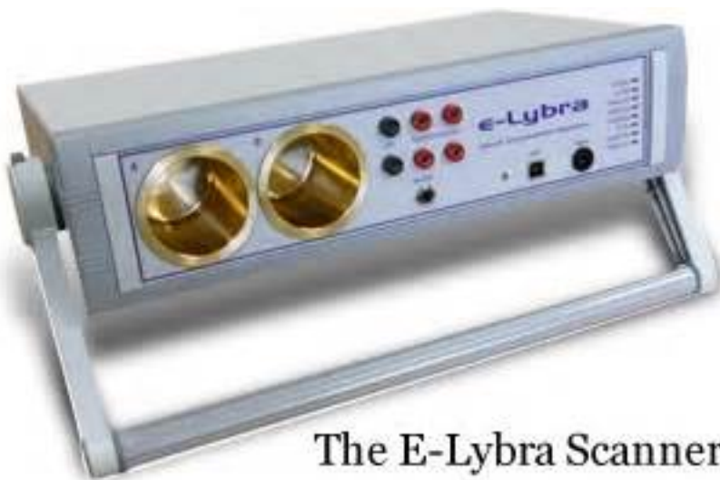
The E-Lybra Scanner

Algumas das funções de análise, correcção e optimização da E-Lybra incluem o seguinte: